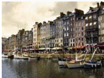
Tableau Impressionnist Old Master _____ 259