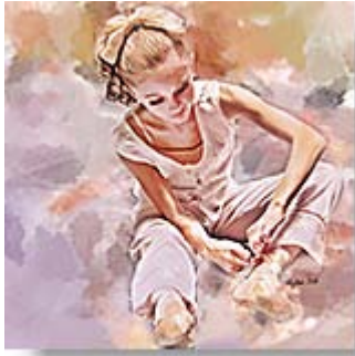
Danseuse avec Impressionist _____ 220