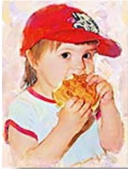
Portrait avec Impressionist _____ 227