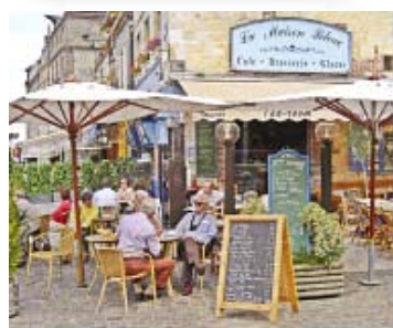
Tableau rapide _____ 124