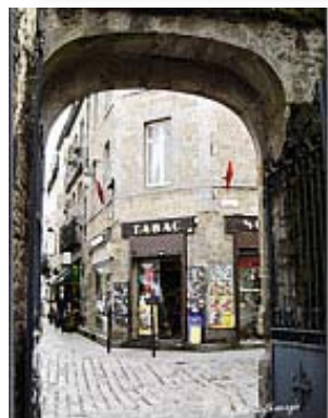
Tableau facile _____ 120