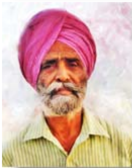
Portrait impressionniste _____ 239