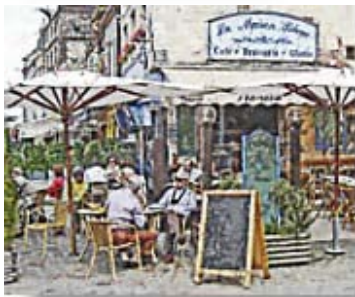
Tableau impressionniste _____ 252